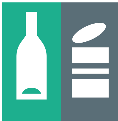
Glass- og metallemballasje