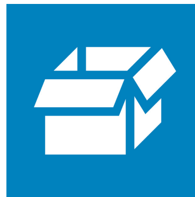
Papp og papir